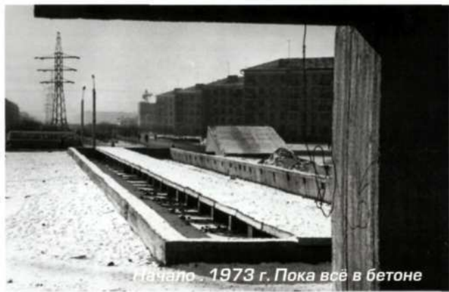
Начало. 1973 г. Пока всё в бетоне

льон «Вечный венок» (иногда его называют так) покрыли брезентовым тентом, топили внутри, сваривали швы, зачищали и тонировали. Было сложно, неудобно, сыро, но времени оставалось в обрез.