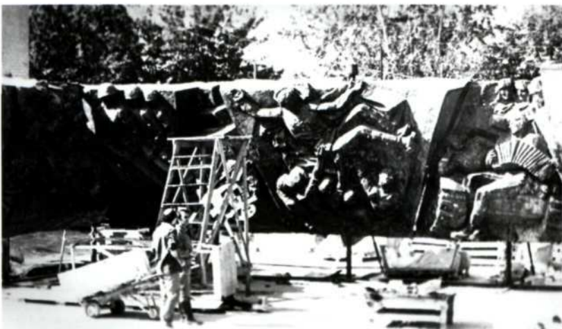
Стыковка элементов Венка славы во дворе скульптурной фабрики. Г. Калуга. 1975 г.