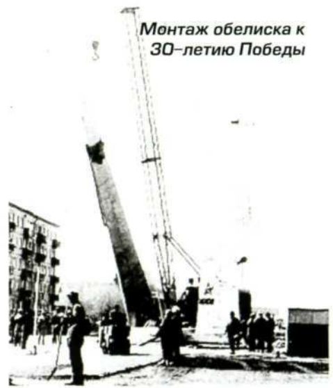
Монтаж обелиска к 30-летию Победы

и ничто не будет напоминать об объекте, стройке, которая стала частью нашей судьбы – архитекторов, скульпторов, строителей, организаторов, заказчиков стройки – УКС КМК. Ведь это часть нашей работы, работы на благо нашего любимого города.