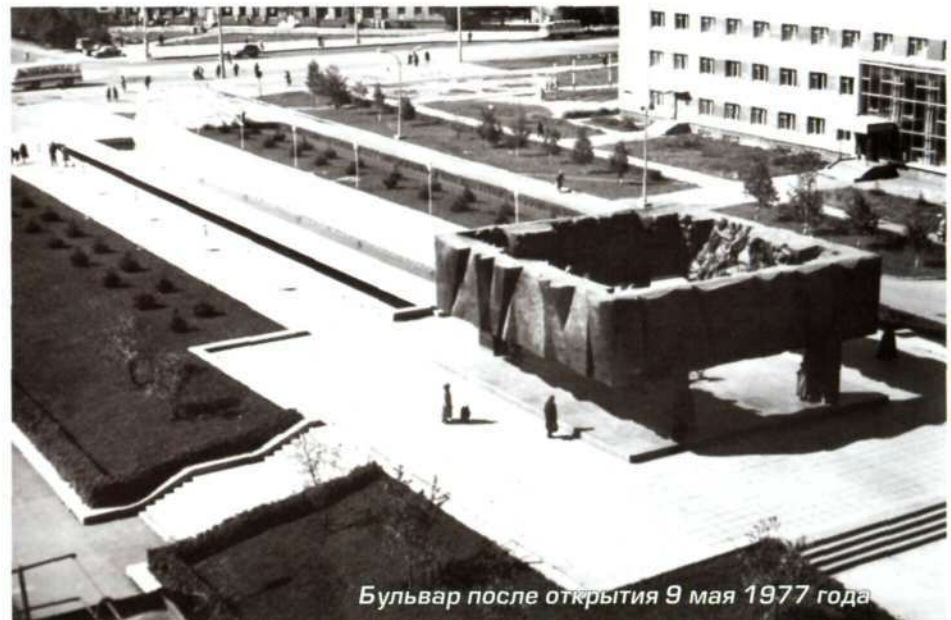
Бульвар после открытия 9 мая 1977 года