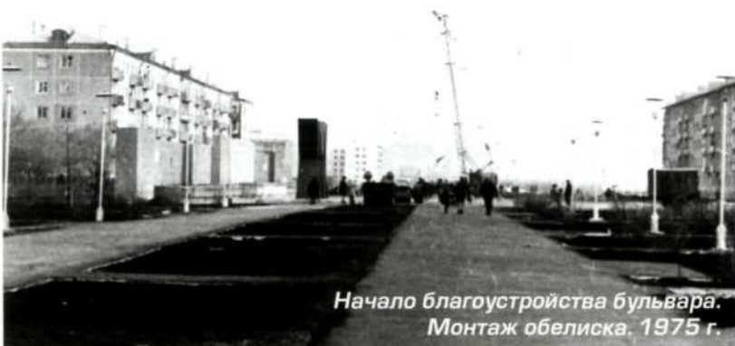
Начало благоустройства бульвара. Монтаж обелиска. 1975 г.