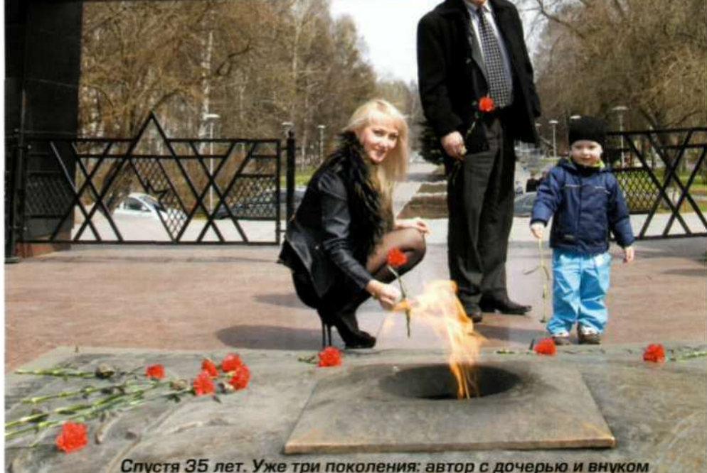
Спустя 35 лет. Уже три поколения: автор с дочерью и внуком