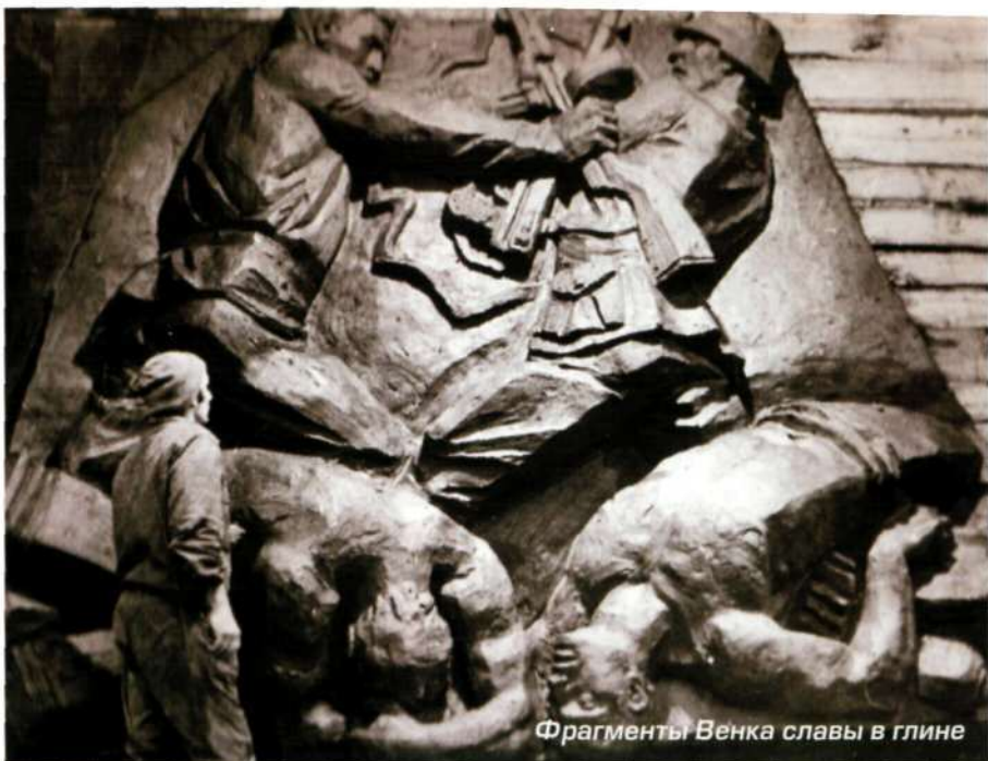
Фрагменты Венка славы в глине

Скульптурная композиция была сложна. Мы по сути создали новую, ранее не